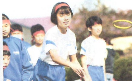
ニュースポーツ4種(輪投げ・グラウンドゴルフ・バグジー・ラダーゲッター)にも挑戦しました