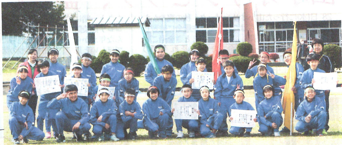
6年生が全ての面で全校をリードして、山小オリンピックを大成功へと導きました