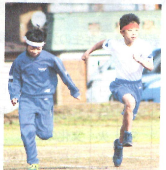
1~3年生は50m走、4~6年生は80m走。ゴールを駆け抜けた全力疾走!! 輝く姿でした