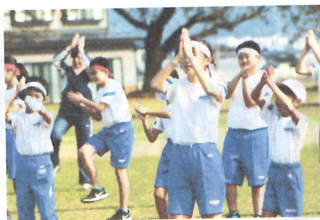
全校ダンス「パプリカ」、秋の日差しを浴び、明るい表情で踊りました