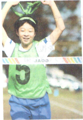
ミニ駅伝、栄光のゴールテープを切ったのは、緑組1 このミニ駅伝は、1年生から6年生まで全ての子どもたちが600m走り切りました