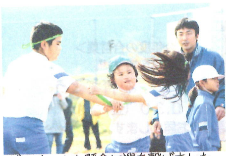
どのチームも懸命に襷を繋ぎました 1年生から6年生が入り交じって走るときも