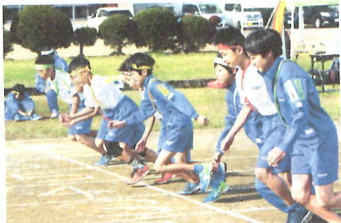
ミニ駅伝、緊張のスタート