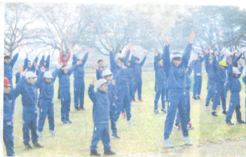
朝霧の名残の中でのラジオ体操