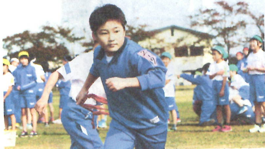
表情にも6年生の責任感が滲み出ました