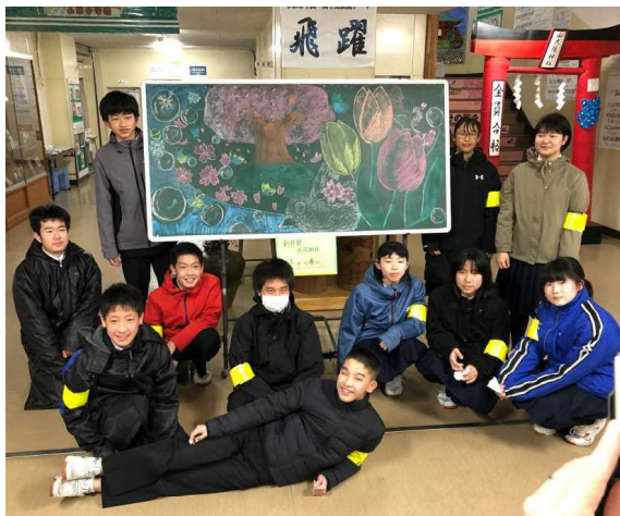
創作部が制作した黒板アート『冬から春へ』

当日は3年生(卒業生)は8:00~8:45の間に登校してもらいます。3年生の保護者の方々は、9:30までご来校ください。駐車場は校舎裏の駐輪場横をお使いください。上履きのご持参のほか、新型コロナウイルス感染防止へのご協力をお願いします。