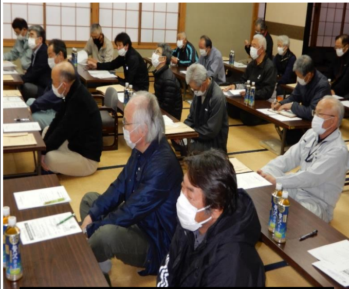
24自治会長が3年度の事業等を審議しました。