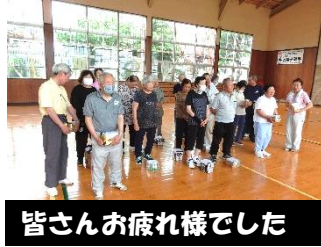
皆さんお疲れ様でした