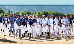
全選手が参加した「開会式」