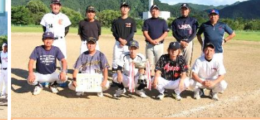
準優勝 松ノ木・団地チーム