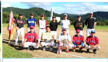
優勝 六日町・福島チーム