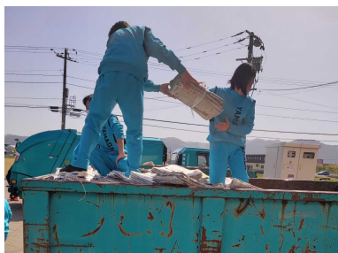
コンテナでの作業も頑張りました。