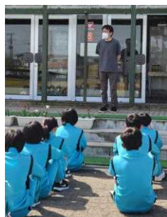
作業終了後に振り返りと感想発表を行いました。 PTA会長さんから、ねぎらいの言葉をいただきました。