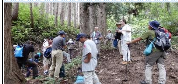
女神像参拝のため小休憩