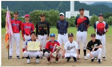
優勝 六日町・福島チーム