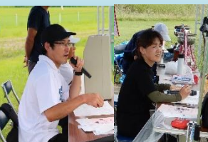
試合を支える大会本部