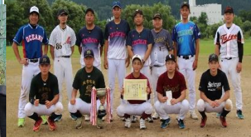
準優勝 白山・八幡林チーム