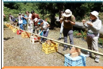
大好評の「流しラーメン」