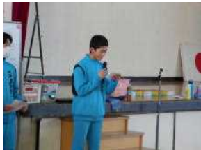
実行委員長あいさつ